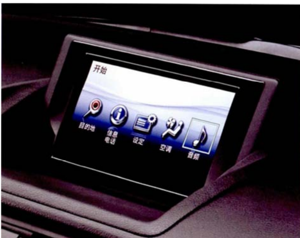
图1 汽车仪表盘服务。

当前,汽车用户对驾驶舒适度和智能化的要求越来越高,现代汽车除了必须提供所有传统汽车的服务外,还需要提供更多的基于汽车仪表盘(如图1所示)的功能来满足用户的需要,如驾驶安全辅助、智能导航、能源优化、智能娱乐、车辆共享等。本文基于此,对于未来的智能网联汽车提出了几种主要的辅助驾驶服务: