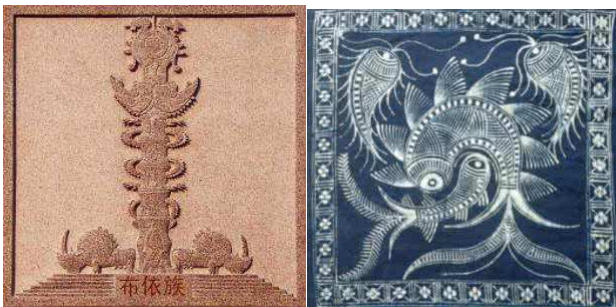
图1 布依族图腾文化。

在镇山村布依村寨建筑各处均可看到大小不一的图腾,或具有装饰效果或有一种特殊意义,不少布依族居民在自家民居的门檐、栏杆、门框、庭院桌柱脚等位置绘制雕刻图案,常以龙凤图案为主,代表了当时人们祈求风调雨顺的思想[3]。布依族是一个勤劳的少数民族,背山而筑面水而居,因此牛的身影也常常出现在他们的生活当中,被村民们当做守护神,保佑家族的平安。布依人的服饰精美绚烂,上面的图案也尤为精细,不少服饰上面均以鱼形图案来绘制,代表了当地居民祈求幸福安康,吉祥如意的美好愿望。不管是建筑上的图腾还是生活中的图腾,布依人用自己的智慧创造出了属于他们自己的精神财富以及对未来美好生活的向往,然而特殊的图案标志也成为了布依人久久不能舍弃的文化财富。(如图1)