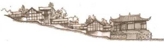
4 内城门外侧坡下空间