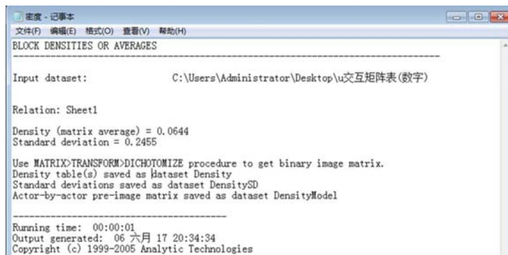
图1 小木虫找工作论坛的交流密度.

整体网络密度计算方法为：“实际存在的关系总数”除以“理论上最多可能存在的关系总数”，实际上等于所有可能存在的线的平均值。小木虫找工作论坛交流密度为0.0644（图1）。