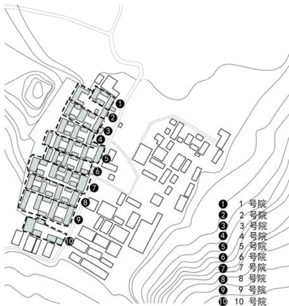
图2 小店河村整体格局。

小店河村于清乾隆十三年初成定局, 虽部分建筑受损, 但整体格局依旧特色鲜明, 具有一定的历史价值。保存较为完整的建筑有十座, 共二十八进四合院, 七十八座房屋。寨门保存完整, 部分寨墙、街巷及标志建筑的布局遗存状况良好。其中, 十处院落自南向北呈一字型坐落于龟形高坡之上, 单个院落坐西向东, 自大门至正房, 依附高坡逐级抬升, 场地内建筑呈现了极强的统一性与韵律感(图2)。