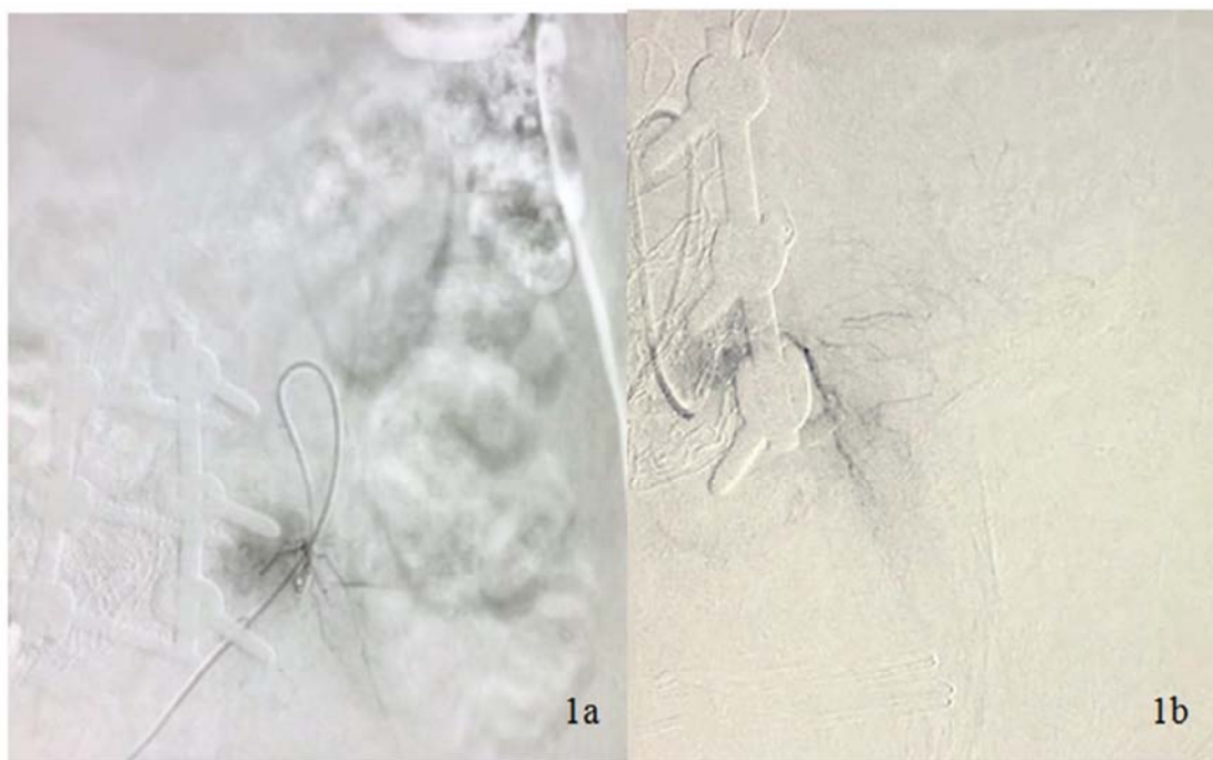
注：1a、1b示介入下行腹主动脉、左右髂总动脉、双侧髂内外动脉及双侧腰动脉、骶正中动脉造影，发现左侧L4-5间腰动脉有造影剂渗漏

术后立即完善血液常规、生化、凝血功能等检查。其中，血小板计数(blood platelet, PLT): 25.00g/L，血小板平均压积(thrombocytocrit, PCT): 0.02%；凝血酶原时间(prothrombin time, PT): 14.3秒，国际标准化比值(international normalized ratio, INR): 1.12，活化部分凝血活酶时间(activated partial thromboplastin time, APTT): 68.8秒，血浆凝血酶时间(thrombin time, TT): 31.3秒，抗凝血酶-III活性(antithrombin III activity, AT-III): 77%。术后继续输注悬浮红细胞400ml、冷沉淀1单位、单采血小板1单位治疗量后，患者血小板及凝血功能情况逐渐好转直至正常，复查腰椎CT未见积血，内固定稳妥(图2)。