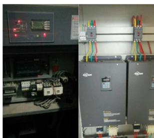
图2 变频器改造方案。