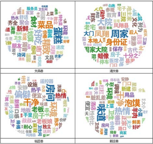
图6 主要街巷店铺大众点评词云图。

评的点评内容来分析居民体验,共爬取到1522条有效数据,然后对点评内容进行词频分析(图6)。分析发现,周家大院的评分最高,点评高频词为“周家、身份证”,通过查阅点评内容,了解到周家大院只需刷身份证即可免费参观。新庄巷内店铺多为餐馆和酒店,有8家农家乐,最大的优点是环境好,但餐馆味道一般;文昌巷内店铺评价普遍较好,但部分商铺卫生状况堪忧;毡匠巷点评内容有“热情、干净、新鲜、便宜”等正向词汇,但消费者一致认为店铺过于偏僻、不便寻找。针对店铺过于偏僻,笔者经实地调研发现,许多商铺均为居民自家房屋改造而成,容易与其他居民房屋混淆,因此不便寻找。