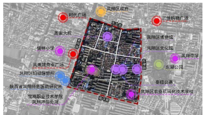
图2 研究区域周边环境。