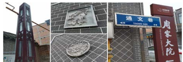
图5 浮于表面的文化符号。

通过现状调研发现, 街区对凤翔历史文化的内涵挖掘不够, 仅仅对物质层面进行了简单的改造: 提取与凤翔文化不相关的花卉元素对街巷两侧建筑进行墙面进行装饰, 使用仿古路灯（图5）。街区内现存有2处历史遗存——周家大院与秦穆公墓, 3处县级祠堂, 但损毁严重。周家大院现已作为小型民俗博物馆供游客参观。秦穆公墓由于性质特殊被封闭管理。总之, 街区的文化浮于表面, 街巷指示标识与周家大院的指示标识风格迥异, 未充分挖掘凤翔文化特色, 文化内涵流失严重。