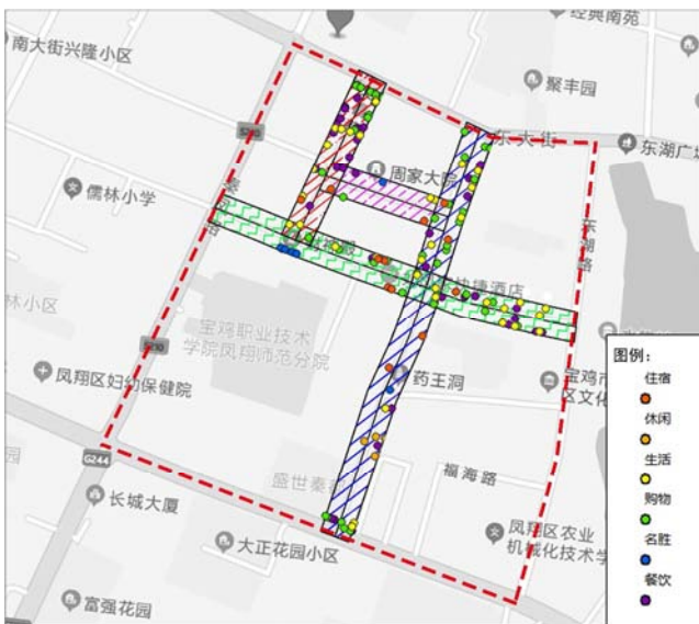
图4 主要街巷50米缓冲范围内的POI分布。

综合图4和表2可以看出, 文昌巷与通文巷功能混合度较低, 业态较为单一, 新庄巷与毡匠巷功能混合度较高, 但功能密度较低, 商业空间不连续, 降低了行人步行体验, 导致街巷较为冷清、缺乏活力。