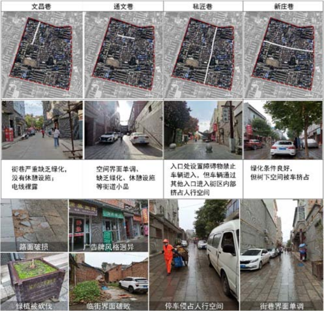
图7 街区物质环境现状。

街区内部多处路面破损,广告牌色彩、风格迥异,毡匠巷临街界面不连续,出现房屋坍塌的问题。景观绿化方