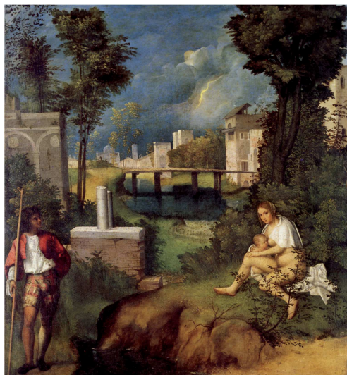
图3 《暴风雨》乔尔乔内 约1505年。