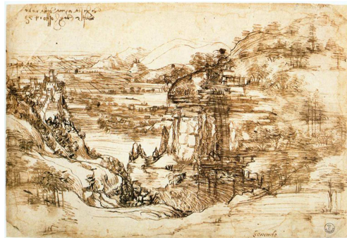
图2 《有河的风景》莱昂纳多·达·芬奇 1473年。

这幅画为广大西方公众所熟知，通过对一种政治宣言在景观上的隐喻解读，传达了帕多瓦城在结束卡拉拉宗主保护关系之后同时遭受瘟疫和威尼斯骚扰的戏剧性情景。景观成为这幅画的独特主题，但不是作为一个自然主义的实体，而是作为一种概念抽象，是在历史进程和当下令人眼花缭乱的直觉之间、自然与人类行为之间的翻转。这幅作品在艺术史上的价值也存在于这种多重含义中。