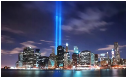
图8 广场辐射灯光 8 。