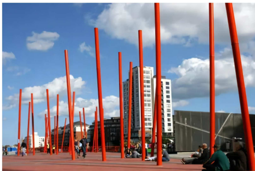
图1 广场红色灯柱 1 。

玛莎·施瓦茨的形象与建构语言，非常突出的表现出极简主义理念所具备的鲜明特征。都柏林大运河广场的景观形态简约凝练，设计元素丰富而统一，在总体上使用了对形态的明晰化、序列化、简约化的处理方法，从而产生了具有概括性且整体风格清晰明确的效果[8]。不难看出整个广场没有明确的空间围合感，但设计师运用材料、颜色、造型、植物等的差异化表达形成了鲜明的领域感。它以丰富的景观形态，反映了玛莎·施瓦茨的极简主义设计思想，富有一定的时代精神。