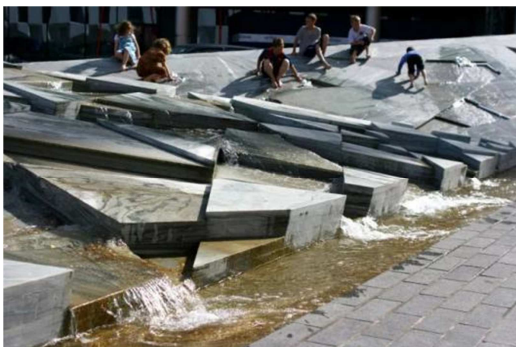
图2 广场叠水景观 2 。