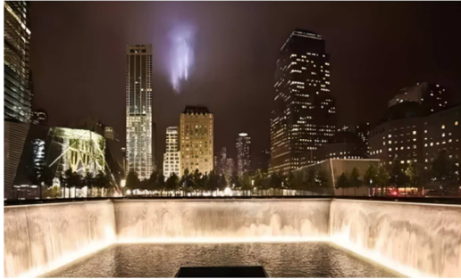
图7 下沉式跌水池 7 。

值得一提的还有场地中极富设计感的座椅（图9），该设计由KBASA工作室完成，座椅形态简约而不单调，与广场主题相契合。也是对极简主义艺术形式的一种诠释。两英亩的场地中包含有184个刻印着受害者姓名的长椅，每一个座椅下方都有一弯浅水，静谧又祥和。置于这氛围之中可冥思、可哀悼、可寄托忧愁与思念，亦如逝者就在身侧。