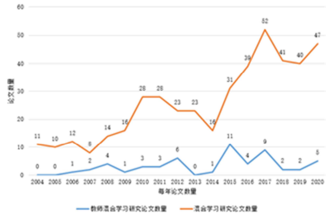
图1 CNKI中混合学习及教师混合学习期刊论文数量变化趋势。

尽管我们对论文的检索是从2001年开始, 但从期刊论文数量分布来分析, 关于教师混合学习的研究从2006年开始, 然后逐渐发展到2015年达到高峰期, 2017年之后有所下降。从CNKI的数据中我们可以看到中国关于混合学习的研究从2004年开始, 以李克东和赵建华及何克抗关于混合学习理论的研究为代表。随后关于混合学习的研究成果逐年上升。从图1的论文变化趋势看, 关于教师混合学习的研究, 在混合学习研究主题中占比不大, 这和马志强等人关于国内近十年混合学习研究趋势研究结果一致[10]。审查的54篇文章中, 有19篇参考了李克东和赵建华的研究[4], 6篇文章参考了何克抗的研究[6]。